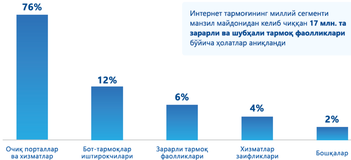
Зарарли ва шубҳали тармоқ фаолликлари (2021 й.)